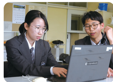
生育調査結果の集計・分析